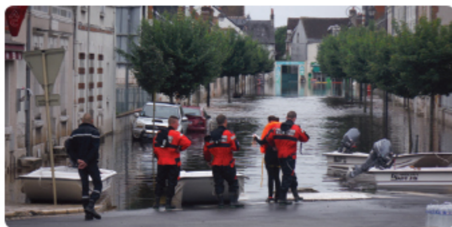
Inondation le 03/06/2016 devant la gare de Romorantin

Deux ans plus tard, les négationnistes ont pris le pouvoir aux États-Unis et l'espoir d'un contrôle rapide du climat s'évapore. Or, pour remplacer tous les combustibles fossiles par des énergies décarbonées, les solutions existantes demandent une mobilisation urgente à tous les niveaux et dans tous les pays gros émetteurs de gaz à effet de serre, à commencer par les États-Unis mais aussi en France où la mise en place d'une transition énergétique rationnelle piétine.