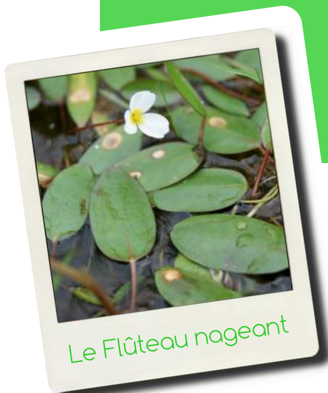
Le Flûteau nageant