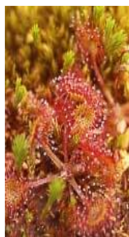
Rossolis à feuilles rondes (Droséra) tourbières

Diverses espèces non protégées ont également disparu ou ont beaucoup régressé. C'est le cas, notamment, de plantes associées aux cultures (les moissons en particulier), comme la Nielle des blés, le Pied d'Alouette, la Nigelle, les Adonis.