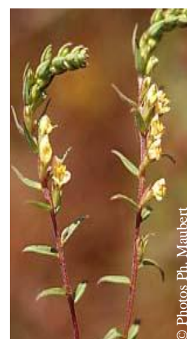
Euphrase de Jaubert jachères calcicoles