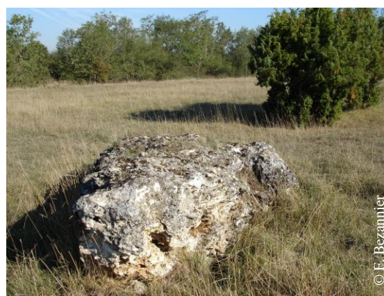
Prairie calcicole – réserve de la Grand Pierre et Vitain

au public dans une dimension pédagogique et / ou d'une pratique des sports de nature.